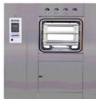
AUTOCLAVES O ESTERILIZADORES