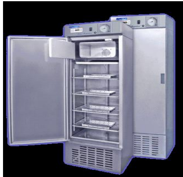
REFRIGERADORES BIOMEDICOS /VACUNAS